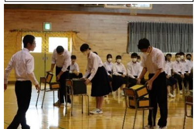
7月3日(月)連合決め集会の様子