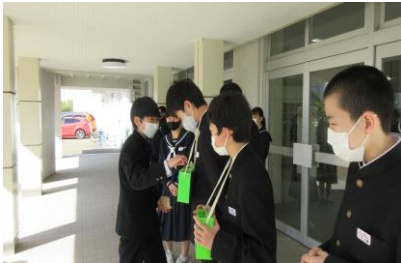
ボランティア委員会 緑の羽根募金の様子