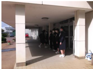
毎朝の生活委員会の活動の様子